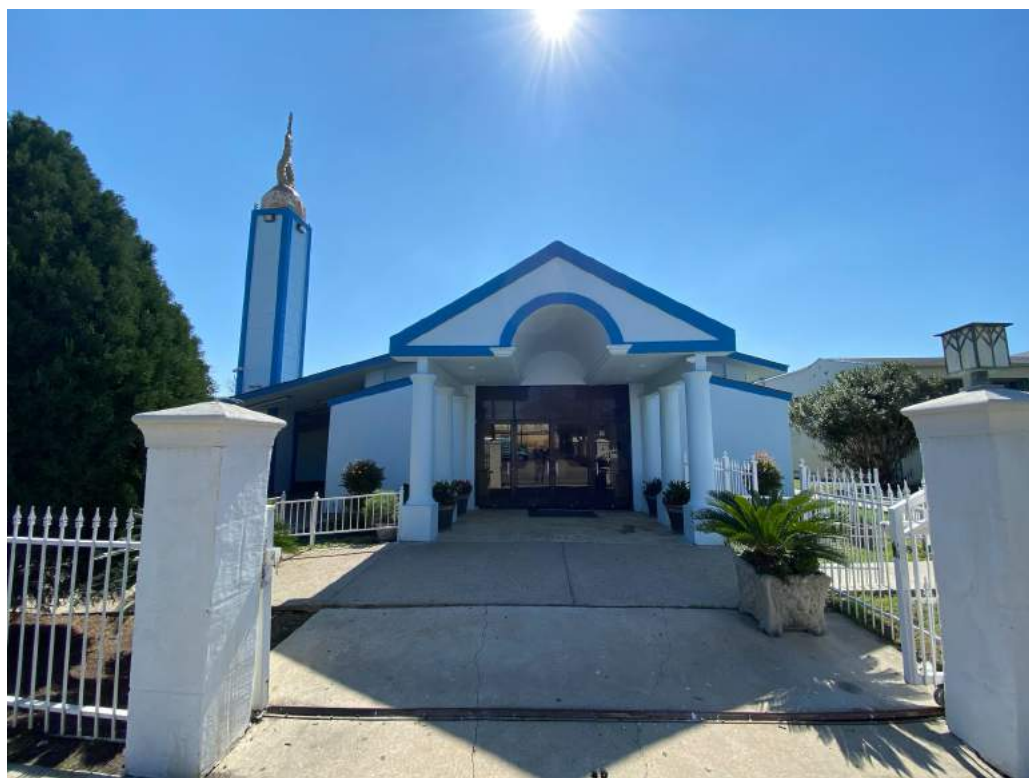
Imagen 2. Templo de La Luz del Mundo en San Antonio.

En 1965, varios predicadores de San Antonio llevarían el mensaje a Houston, trabajando desde una pequeña casa durante varios años antes de comprar terrenos en la calle de Bostic en el noreste de Houston, donde los feligreses erigieron una pequeña iglesia en la que pudieron incorporar las estructuras únicas que identifican los centros de culto de La Luz del Mundo alrededor del mundo (Wyatt 2011).