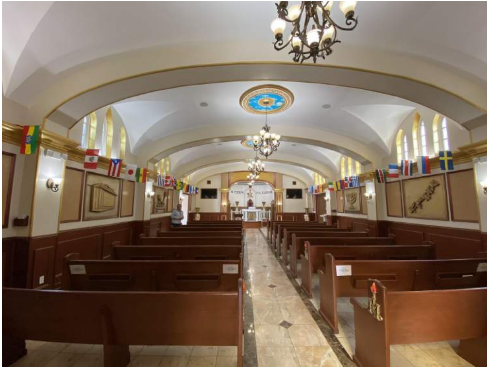
Imagen 3. Interior, templo en el centro de Los Ángeles, enero 2020.

Los templos del centro de Los Ángeles y Long Beach tienen dos pisos de altura e incluyen decoraciones ornamentales e iconografía judía y cristiana en las paredes. Notablemente, las iniciales del actual Apóstol, Naasón Joaquín García, se encuentran en los principales santuarios (ver imagen 4), al igual que en el este de Los Ángeles, como una señal de respeto para el líder. De hecho, noté que las iniciales estilizadas NJG también formaban la base de una calcomanía que se encuentra en la parte trasera de los coches de los miembros de la LLDM, que sirve como un identificador externo que tiene utilidad religiosa en la cultura de la conducción de coches de California. Otro rasgo distintivo, común a todos los templos que visite, es la colocación de una silla de honor reservada para el Apóstol Naasón frente al altar. El púlpito de cada templo se coloca al lado del área principal, lo cual me dicen sirve para enfatizar el elevado estatus del Apóstol en relación con al ministro local y a otros oradores. También me llamó la atención la prominencia, en la entrada de los templos, de desinfectantes de manos para asegurar la limpieza y la pureza una vez en el templo. Aún más sorprendente, sin embargo, es la colocación de estatuas de leones (con una pata levantada) en algunos templos, como el este de Los Ángeles y el centro de la ciudad Los