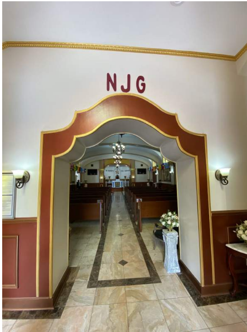
Imagen 4. Iniciales del Apóstol Naasón Joaquín García, en la entrada del templo en el centro de Los Ángeles, enero 2020.

Ángeles. Finalmente, me intrigó saber que cada templo tiene una casa vecina o cercana para el ministro y su familia. Los ministros de tiempo completo sirven por tres años antes de ser rotados a otro lugar determinado por el liderazgo superior de LLDM.