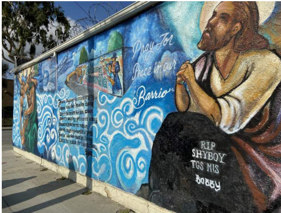
Imagen 5. Mural en callejón cerca del templo en el este de Los Ángeles, enero 2020.

Hoy en día, el área que rodea el templo es bastante segura y transitable, y mis guías me dijeron que la mayoría de los residentes de los alrededores, al menos el 75% por su estimados, son miembros de LLDM. Caminando alrededor de la manzana, mis guías señalaron la casa ocasional que no era propiedad de un miembro de la LLDM, y estos estaban típicamente en algún estado de deterioro, en agudo contraste con las casas de los miembros de la Iglesia con patios limpios, pintura fresca, automóviles de modelos reciente, y familias vistas jugando en los patios delanteros y traseros.