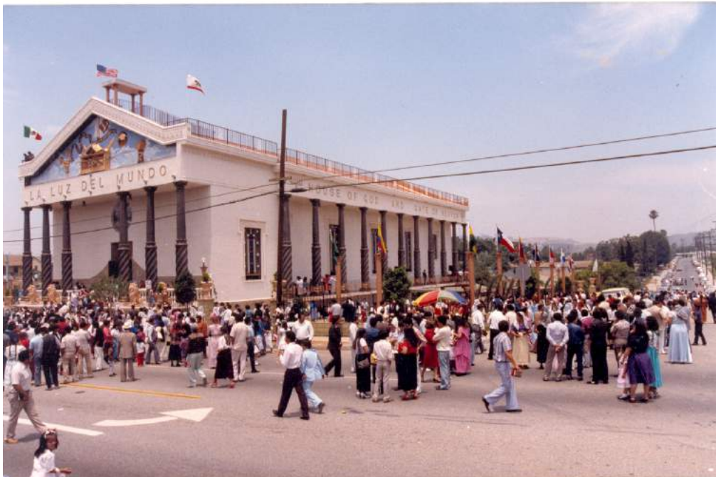
Imagen 1. Templo en el este de Los Ángeles, Inauguración, 1985.

La primera presencia eclesiástica de LLDM fue una casa-iglesia ubicada en la calle San Pedro y 87 (Estrada 2020), y de hecho las casa-iglesias siguen funcionando como lugares de misión en zonas donde los templos son demasiado remotos. Sin embargo, los miembros pronto superaron esta ubicación y se trasladaron al otro lado de la calle de la futura ubicación del templo LLDM en el este de Los Ángeles. La iglesia continuó expandiéndose, y a principios de la década de 1970 LLDM compró un terreno en el 112 North Arizona Avenue, donde los miembros de la iglesia construyeron ellos mismos el templo actual, aprovechando las habilidades y fortalezas de los miembros que vivían a los alrededores. El templo del este de Los Ángeles tiene más de 1,000 asientos y fue inaugurado por el segundo Apóstol de LLDM, Samuel Joaquín Flores (1937-2014), en 1985 (véase la imagen 1). En 2005, el Apóstol Samuel visitó la iglesia de Los Ángeles para celebrar el 50º aniversario del ministerio de la LLDM en la zona.